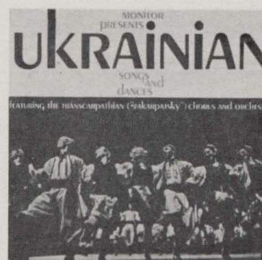
MF 334 SONGS AND DANCES OF THE UKRAINE, Vol. 4.