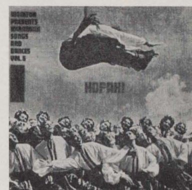
MF 376 HOPAK! UKRAINIAN SONGS AND DANCES, Vol. 5.