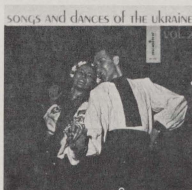
MF 308 SONGS AND DANCES OF THE UKRAINE, Vol. 2.