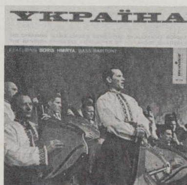
MF 315 YKPAIHA: THE UKRAINIAN DUMKA CHORUS.