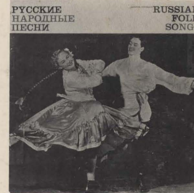
MF 302 RUSSIAN FOLK SONGS Famous Choruses and Soloists