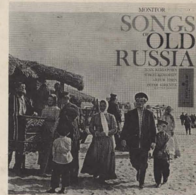
MP 560 SONGS OF OLD RUSSIA

For complete catalogue and Russian text of these songs write: