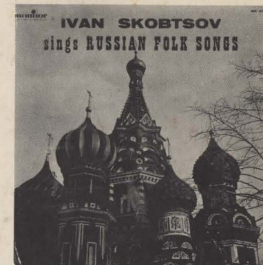
MC 2001 IVAN SKOBTSOV SINGS RUSSIAN FOLK SONGS