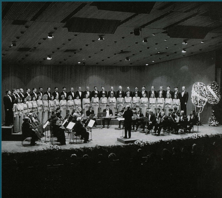
The National Choir of Turkish Classical Music Le Chœur national de Musique classique turque